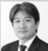
桐生先生 ・雇用保険法 ・徴収法 担当